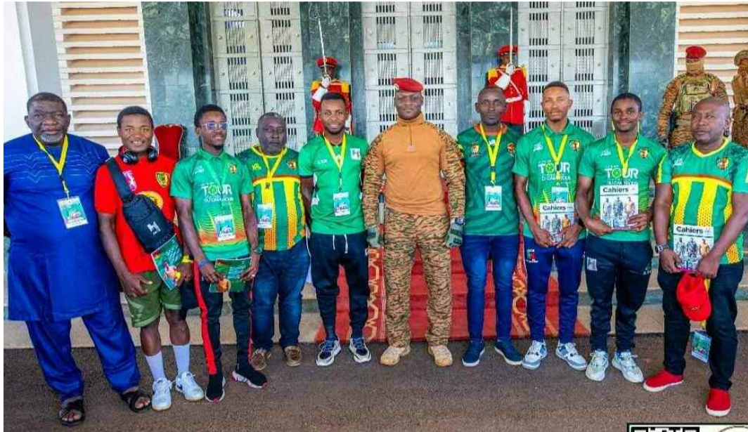
Ouagadougou, le 4 novembre 2024. La délégation des coureurs et encadreurs camerounais reçue au palais présidentiel avant leur retour au Cameroun, par le chef de l'Etat, le Capitaine Ibrahim Traoré